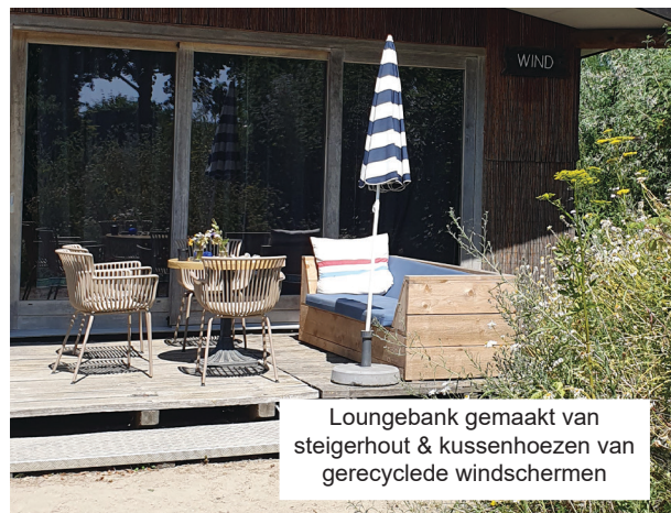
Loungebank gemaakt van steigerhout & kussenhoezen van gerecyclede windschermen