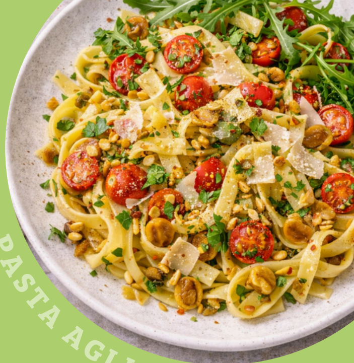
PASTA AGLIO E OLIO