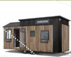
● Tiny Beach House