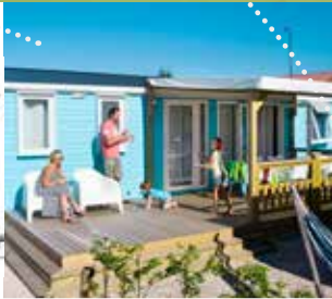
● Strandchalet de Luxe