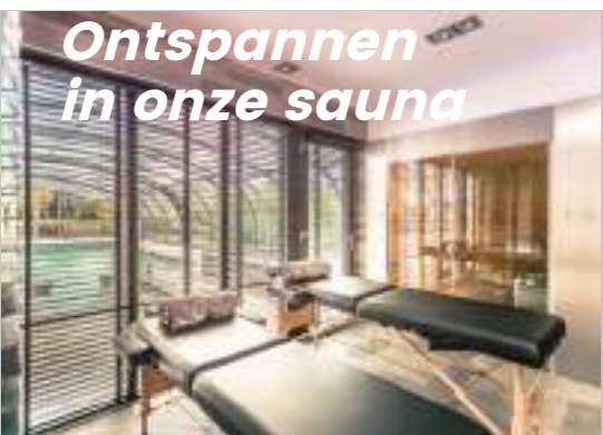
Ontspannen in onze sauna