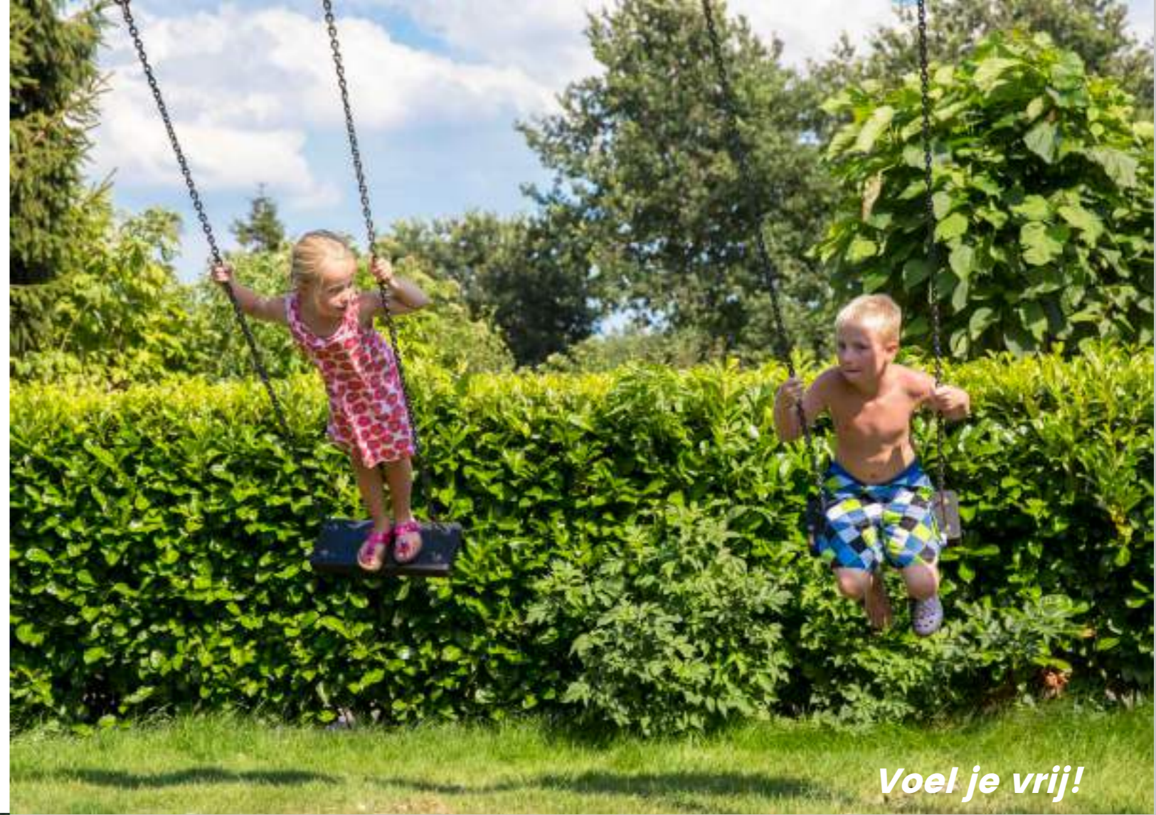
Voel je vrij!