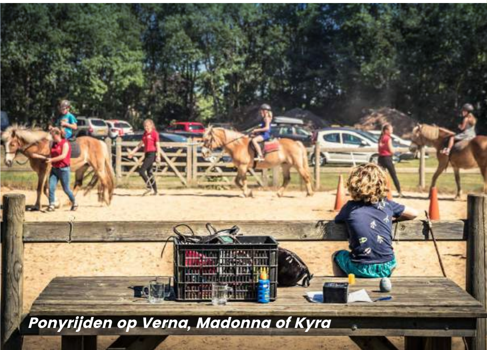
Ponyrijden op Verna, Madonna of Kyra