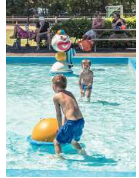
Zwemmen in het buitenbad