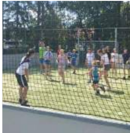
Eindeloos veel speelplezier!