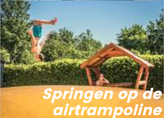
Springen op de airtrampoline