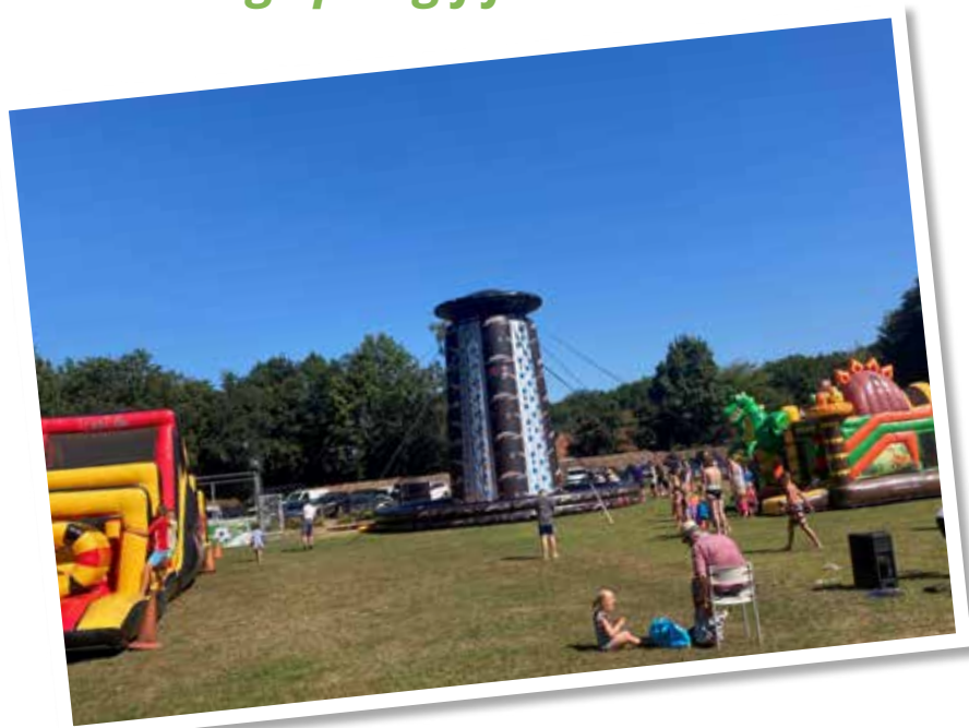
Vriendjes zijn zo gemaakt!