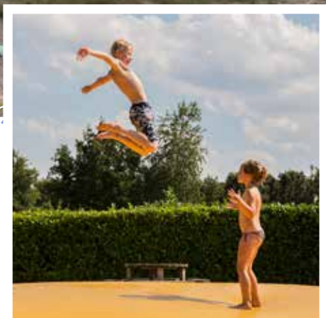
Hoe hoog spring jij?