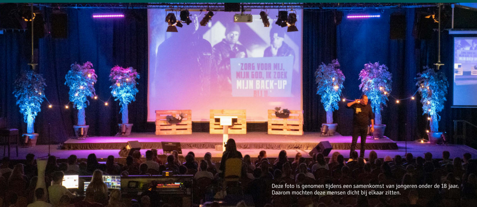
Deze foto is genomen tijdens een samenkomst van jongeren onder de 18 jaar. Daarom mochten deze mensen dicht bij elkaar zitten.

Op basis van het maximale aantal personen. Wanneer er 1-persoons huishoudens deelnemen is het aantal personen uiteraard lager.