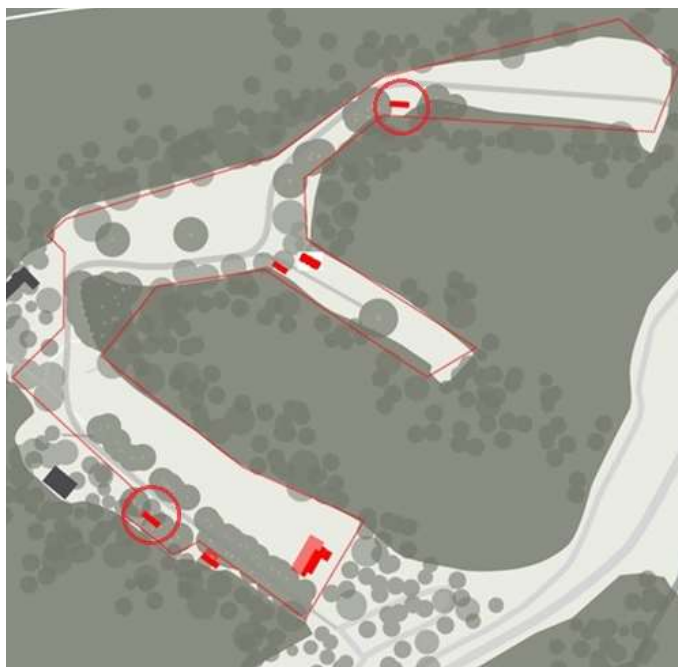
Oorspronkelijke situatie facilitaire gebouwen rood omcirkeld = gebouwen verwijderd in 2015/2016