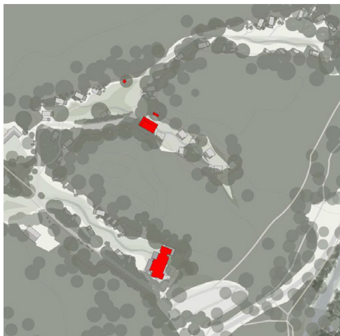
Nieuwe situatie facilitaire gebouwen